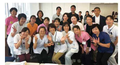
豊田加茂訪問看護ステーション会管理者の皆様

そして、在宅療養者と家族が、安心して療養できるまちづくりに貢献していきたいと思ひます。